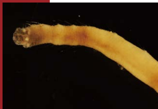
クマノアシツキ科のゴカイ