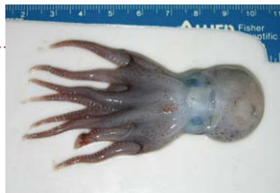
オグラグンバイダコ